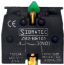
ZB2-BE101 Contato NA Linha XB2