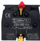
ZB2-BE102 Contato NF Linha XB2