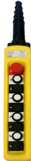
XAC-A8713-8 8 Botões + Emergência