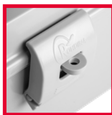
Fecho com suporte para cadeado