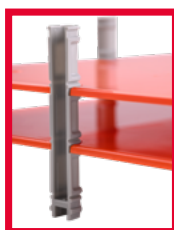
Uma placa de montagem